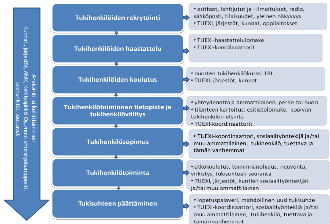
Kuvio 1. Tukihenkilötoiminnan prosessi TUEXI-hankeessa

Tukihenkilötoiminta perustuu lastensuojelulakiin 417/2007, jonka mukaan lapselle on tarvittaessa järjestettävä avohuollon tukitoimena tukihenkilö tai -perhe. Tukihenkilötoiminta voidaan myös nähdä osana uutta lastensuojelulain määrittelemää ehkäisevää lastensuojelua. Hankkeeseen rekrytoidaan ja koulutetaan tukihenkilöitä. Tukihenkilöt saavat tehtävänsä asianmukaisen ja ammatillisesti ohjatun koulutuksen sekä riittävän ohjauksen ja tuen. Hankkeen tavoitteena on myös kehittää ja ylläpitää tukihenkilön välitystoimintaa sekä tietopankkia tukipalvelujen tuottajista, henkilöistä ja toiminnasta. Hankkeen tuloksena syntyy toimintamalli alueellisesta tukihenkilöprosessista. (Heimo & Haclin-Larumo 2006, 3.)