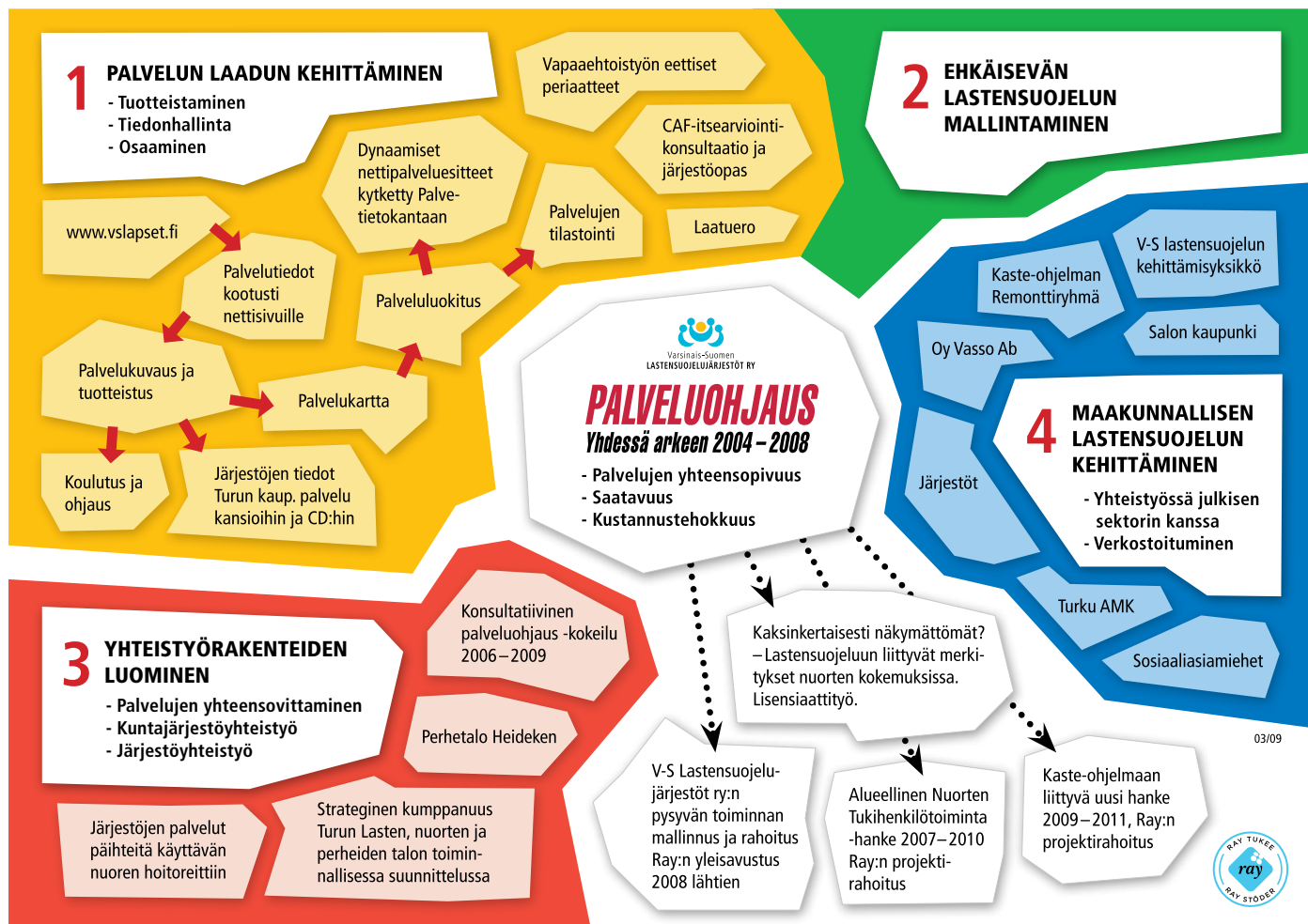
Palveluohjaus-hankkeen kehittämissympäristö – keskeiset tavoitteet ja tuotokset

Palvelujen luokittelun yhteydessä tuotettiin nettipalveluesitteinä myös järjestöjen peruspalveluihin ja lapsi- ja perhekohtaiseen lastensuojeluun liittyvien palvelujen mallinnus.